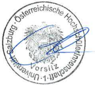
Cedric Keller, Vorsitzender

mit diesem Schreiben teilen wir Ihnen mit, dass im Wirtschaftsjahr 2023/2024 vom 01.07.2023 bis zum 30.06.2024 keine freien Dienstverträge abgeschlossen wurden und keine freien Dienstverträge vorliegen.